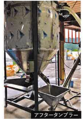
アフタータンブラー